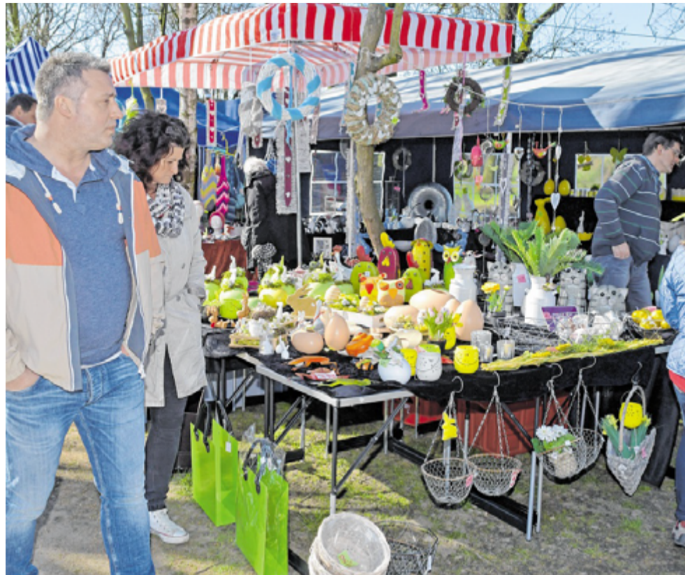
Zum dritten Mal findet im März der „Frühlingsmarkt“ auf dem Hof Holz statt. Er ist eine der ersten Freiluft-Veranstaltungen auf dem Gelände an der Braukämperstraße.

Der Ostersonntag ist traditionell ein starker Tag auf dem Hof an der