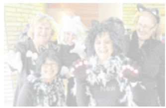
Westerholter Frauen feiern ausgelassen Karneval.