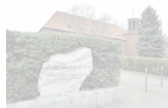
Gefeiert wird erst in der Kirche, dann im Paul-Gerhardt-Haus.